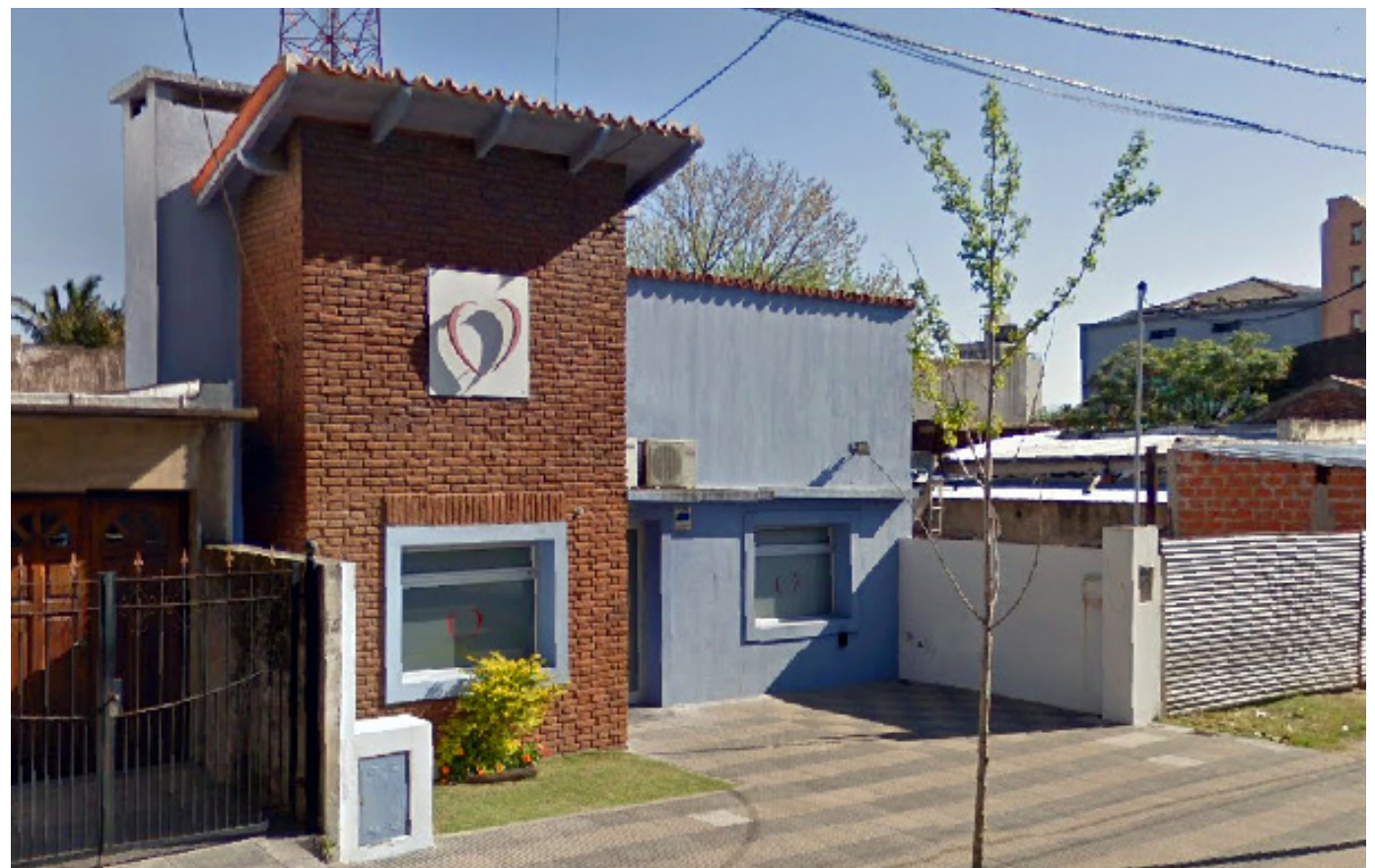
Consultorio Cardiológico Integral